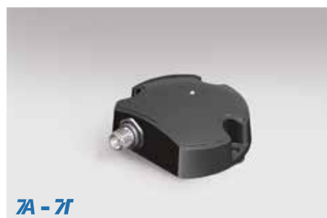
7A - 7T