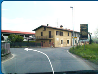
E Am Abzweig nach links abbiegen.