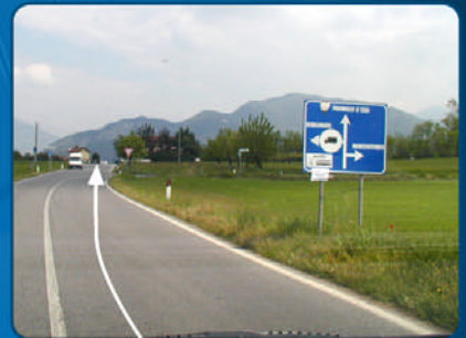
F Ungefähr 1.400 m gemäß den Richtungsangaben nach „Provaglio d'Iseo“ weiterfahren.