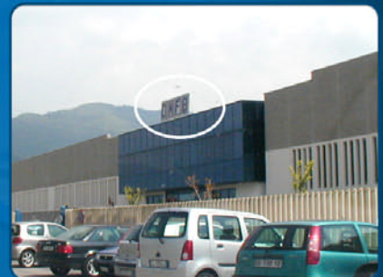
I OMFB befindet sich in der unmittelbar darauf folgenden Werkhalle.