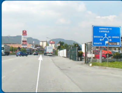
B Ungefähr 300 m weiterfahren.