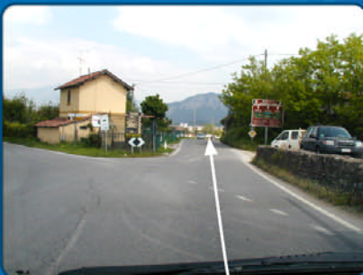
G Am Abzweig rechts halten.