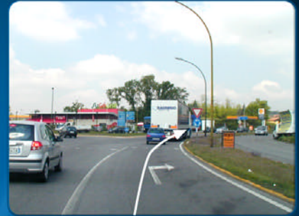
C Beim Kreisverkehr den ersten Abzweig nach rechts in Richtung Iseo nehmen und ungefähr 4 km weiterfahren.