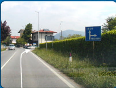
D Gleich hinter dem Richtungsschild nach „Passirano“ nach rechts abbiegen und ungefähr 1.400 m weiterfahren.