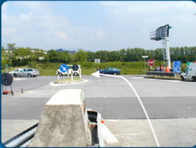
A Von der Autobahnausfahrt Rovato nach links abbiegen (rechts halten).